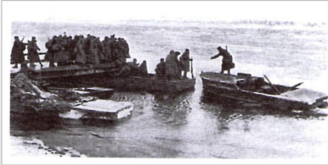
Форсирование реки красноармейцами