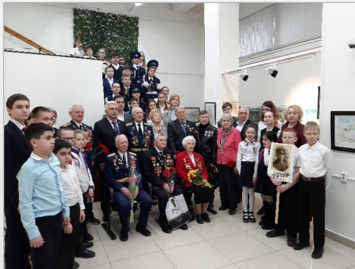
Участники Вахты Памяти в г. Реутов