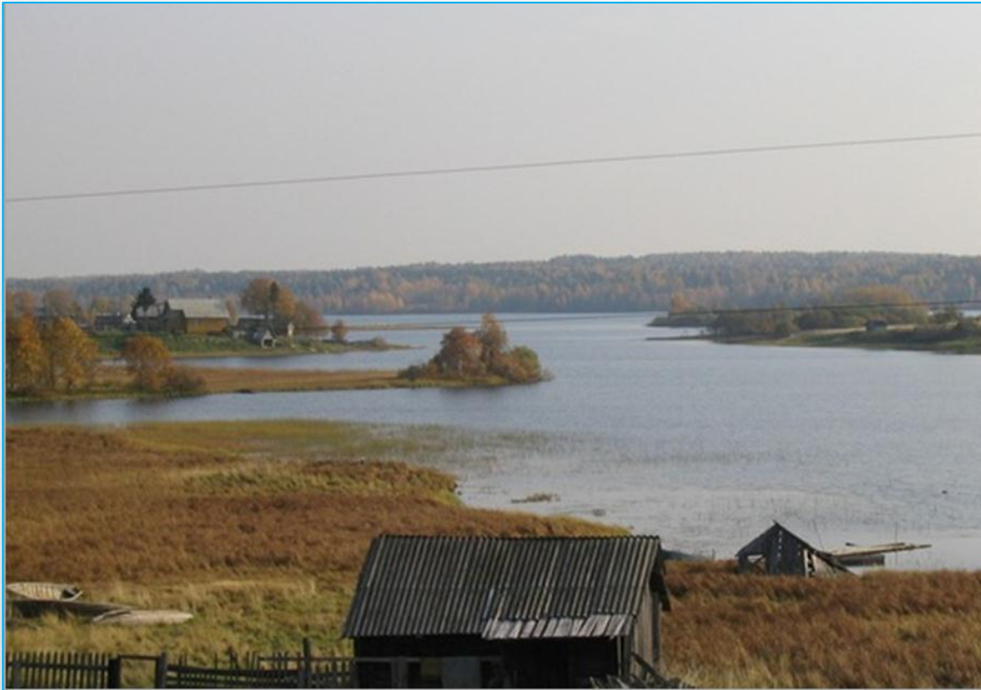
С. Коткозеро, улица Олонецкая